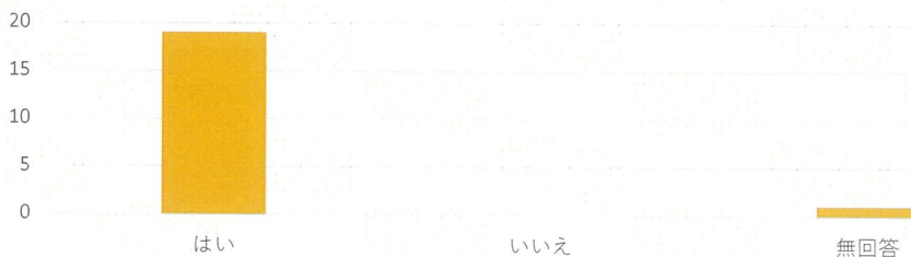
（独自設問）ご利用者の生活状況や身体状況の報告が行われていますか。