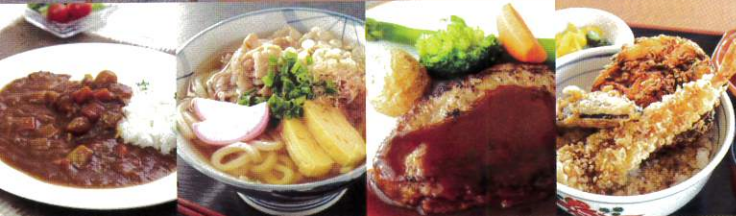
※調理写真はイメージです。

管理栄養士が献立を考えた日替わり定食を軸にし、麺類やカレー、とんかつ定食など約30種類以上のメニューを用意し、入居者様にはできるだけその日の気分に沿った食券制を選択して頂けるようにしました。